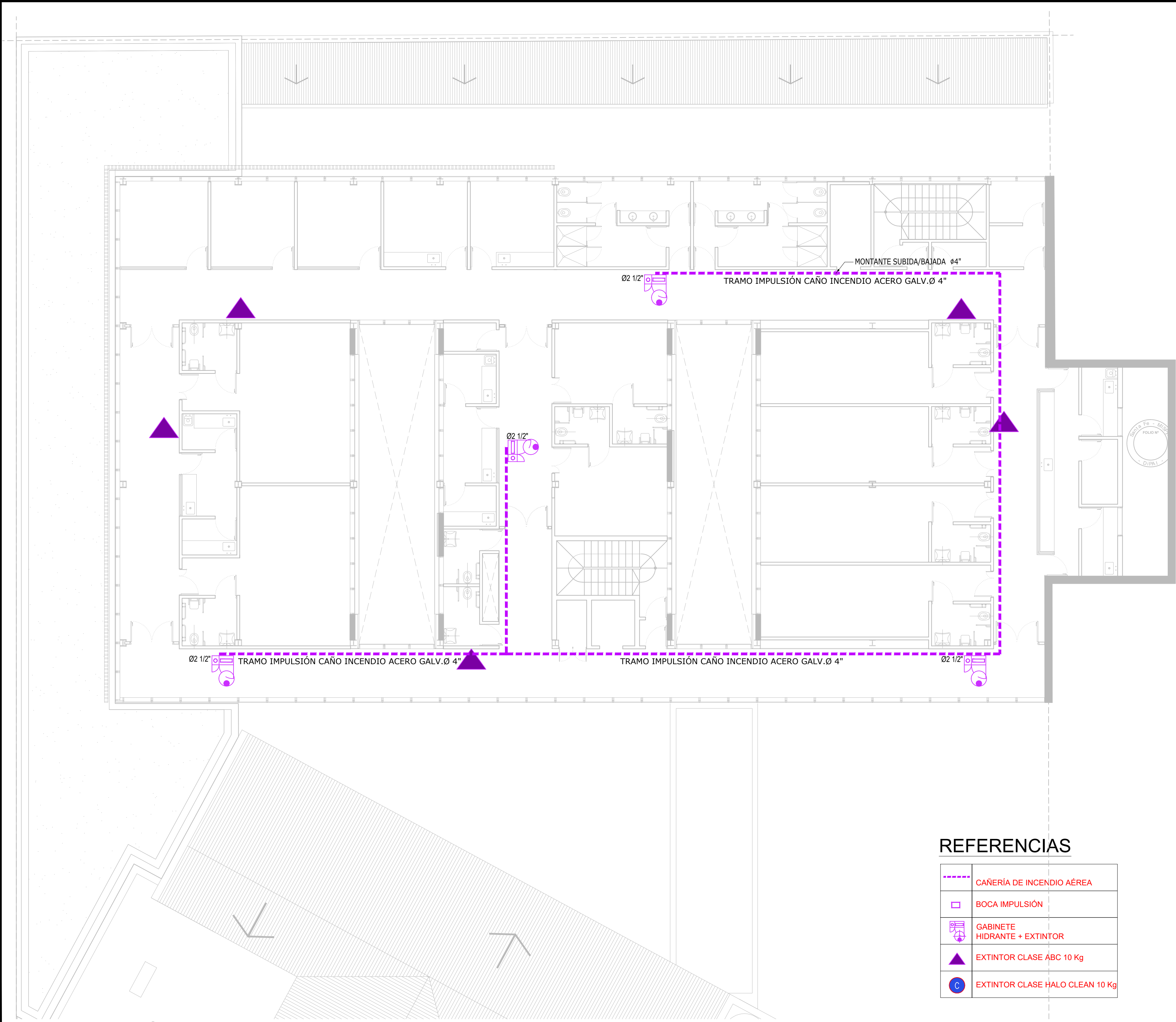
INSTALACIÓN DE INCENDIO PLANTA PRIMER PISO